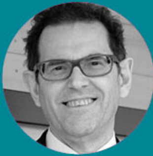
Jakob Stark, Präsident Lignum Holzwirtschaft Schweiz